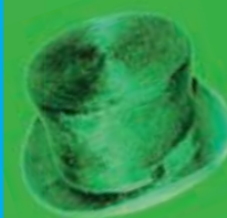
Le Trio KUPZEC